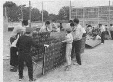
地元の小学校で開いた太陽光発電の出張事業